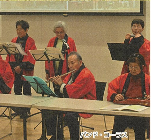
バンド・コーラス

当センターでは、会員の「健康」「余暇活用」「会員相互の親睦」を目的に互助会があります。その中には九つの自主クラブがあり、それぞれに活発に活動し楽しんでます。今回は、その活動の様子を紹介します。興味のある方は、のぞいてみてください。詳しい活動場所等はセンターにお問い合わせください。